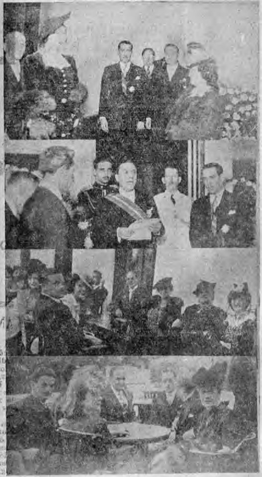
Interesantes aspectos de la espléndida recepción ofrecida anoche en honor de señor Presidente de la República de Panamá, doctor Arias, en cuyo acto el jefe del estado de la nación costarricense impuso la condecoración de la orden nacional panameña de Vasco Núñez de Balboa al señor Presidente de la República de Costa Rica, doctor Calderón Guardia, quien aparece en la foto del medio haciendo el discurso con que aceptó y agradeció el homenaje de que fue objeto.

Unico Distribuidor BAZAR MORANO Bajos del Diario de Costa Rica