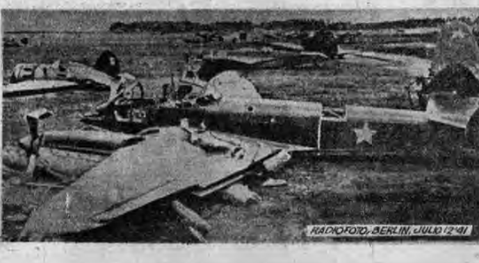
RADIOFOTO, BERLIN, JULIO 12/41